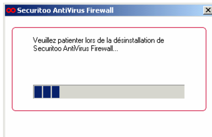
Figure 7 : Progression de la désinstallation

Etape 3 : Une fenêtre vous montre la progression de la désinstallation :