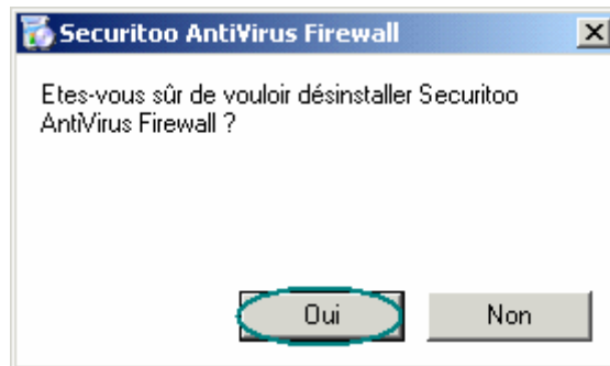
Figure 6 : Confirmation de la désinstallation

Etape 2 : Une fenêtre s'ouvre et vous demande de confirmer la désinstallation en cliquant sur le bouton Oui .