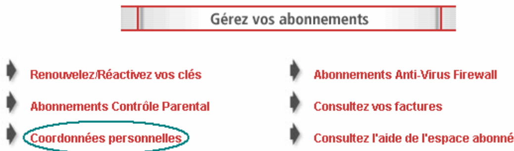
Figure 2 : Gestion de l'abonnement

Etape 2 : Vous accéder alors à votre espace abonnés. Cliquez sur "Coordonnées personnelles".