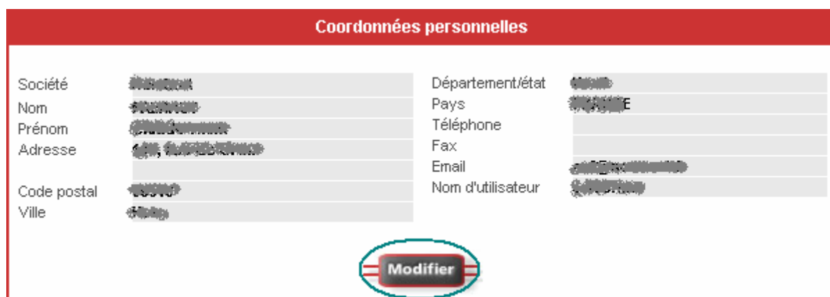
Figure 3 : Coordonnées personnelles

Etape 3 : Cliquez sur le bouton Modifier .