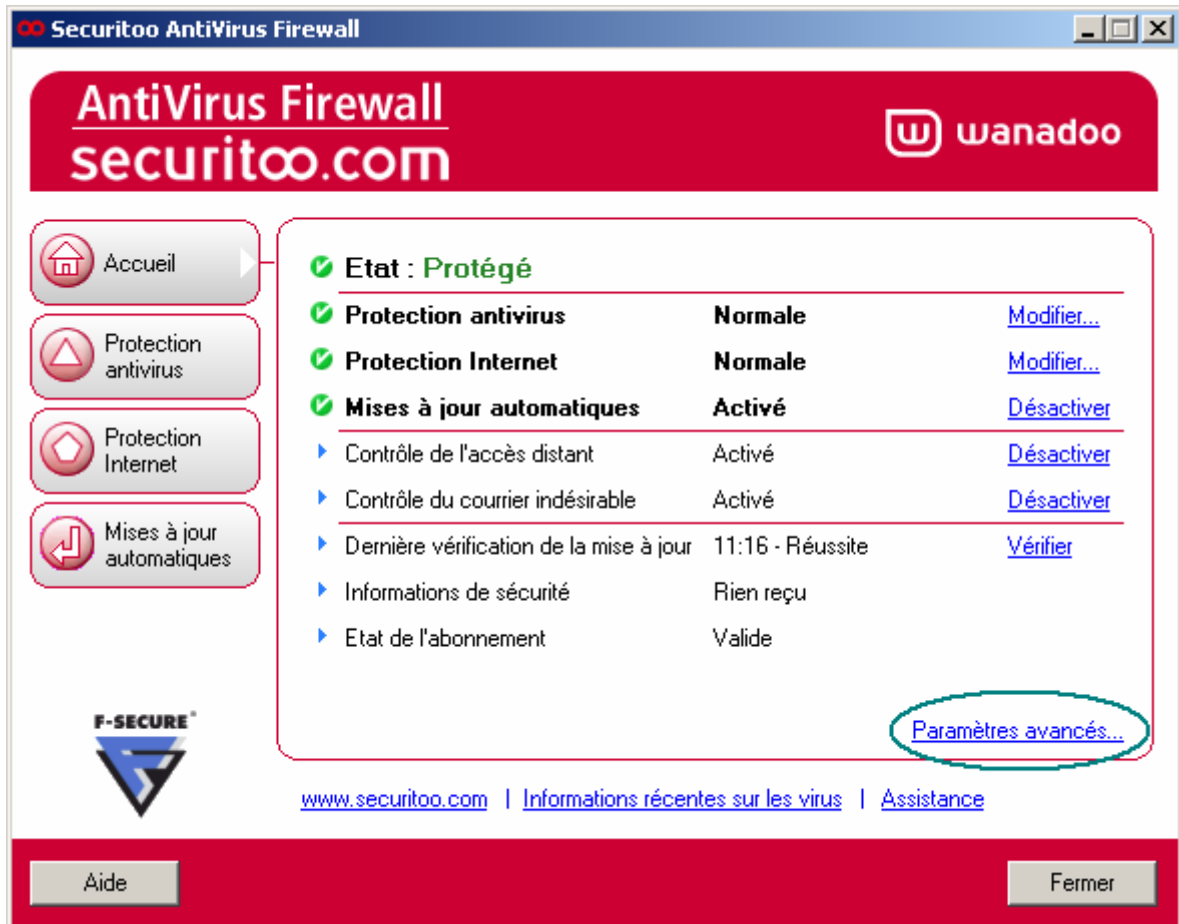
Figure 2 : Firewall

Etape 2 : Cliquez sur "Paramètres avancés..."