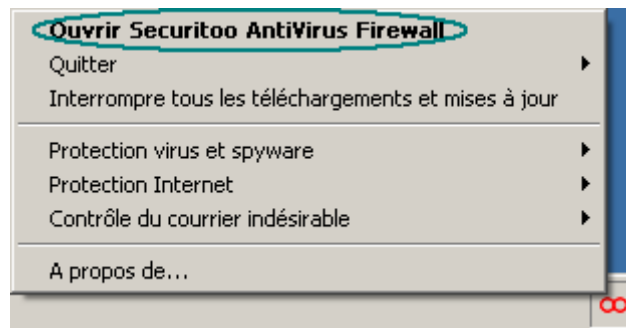
Figure 1 : Ouvrir Securitoo Antivirus Firewall

Etape 1 : Cliquez avec le bouton droit de la souris sur l'icône de Securitoo, située en bas à droite à coté de l'heure. Puis cliquez sur "Ouvrir Securitoo Antivirus Firewall"