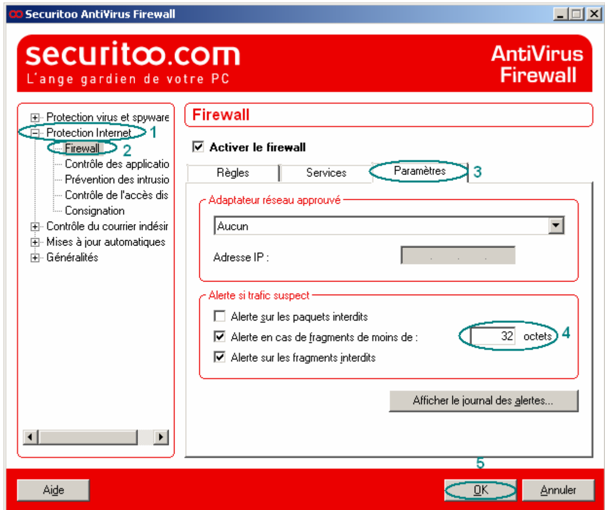
Figure 3 : Taille des paquets

Votre navigation doit alors fonctionner correctement.