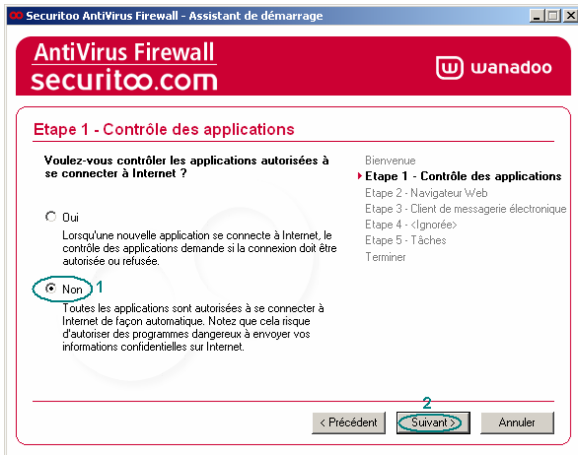
Figure 2 : Contrôle des applications

Etape 2 : Sélectionnez "Non" (1), puis cliquez sur le bouton Suivant (2).