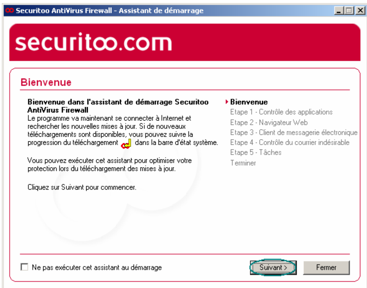
Figure 1 : Bienvenue

Etape 1 : Une fenêtre de Bienvenue s'affiche. Cliquez sur le bouton Suivant .