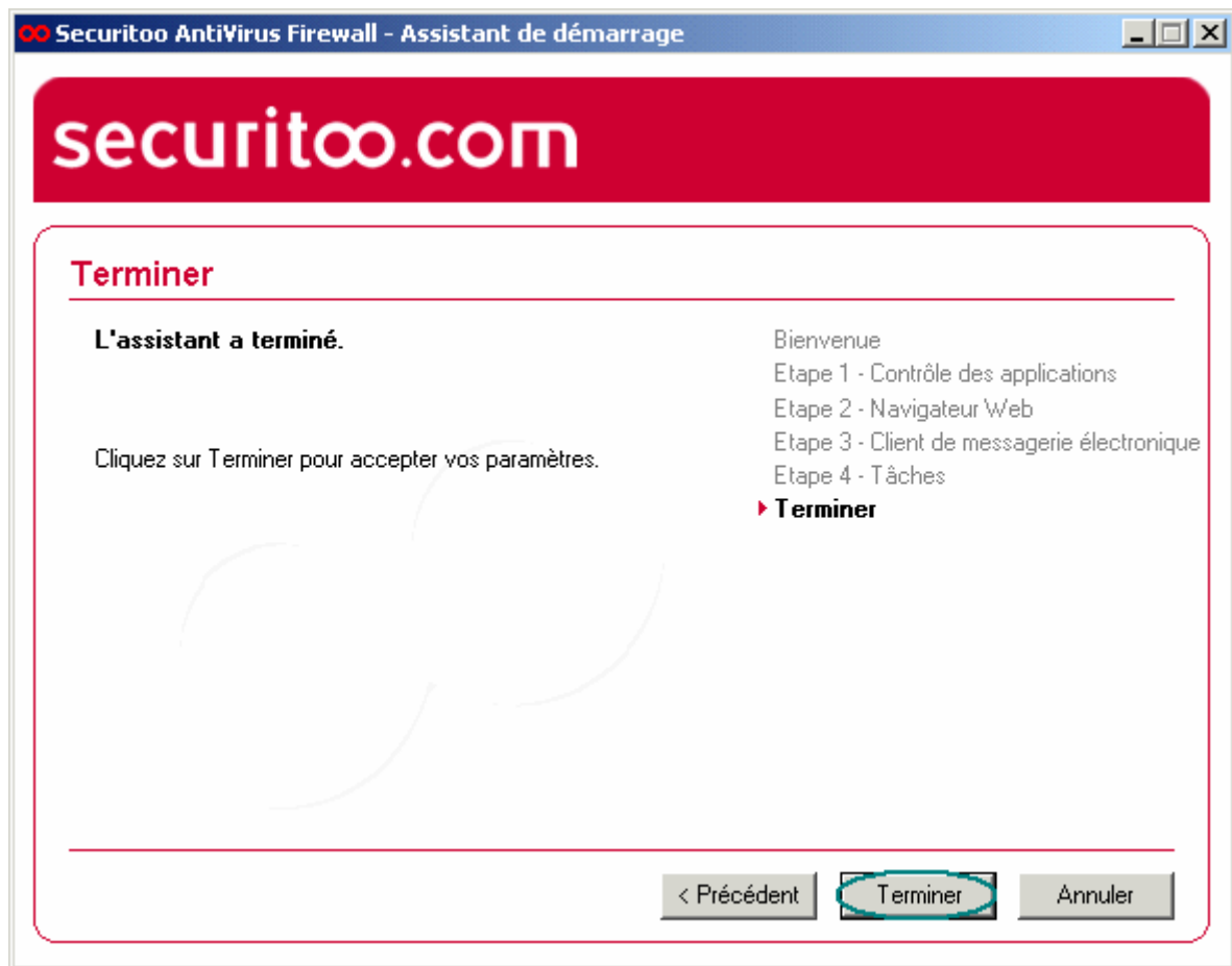
Figure 5 : Assistant de démarrage terminé

Etape 5 : Cliquez sur le bouton Terminer pour fermer l'assistant de démarrage.