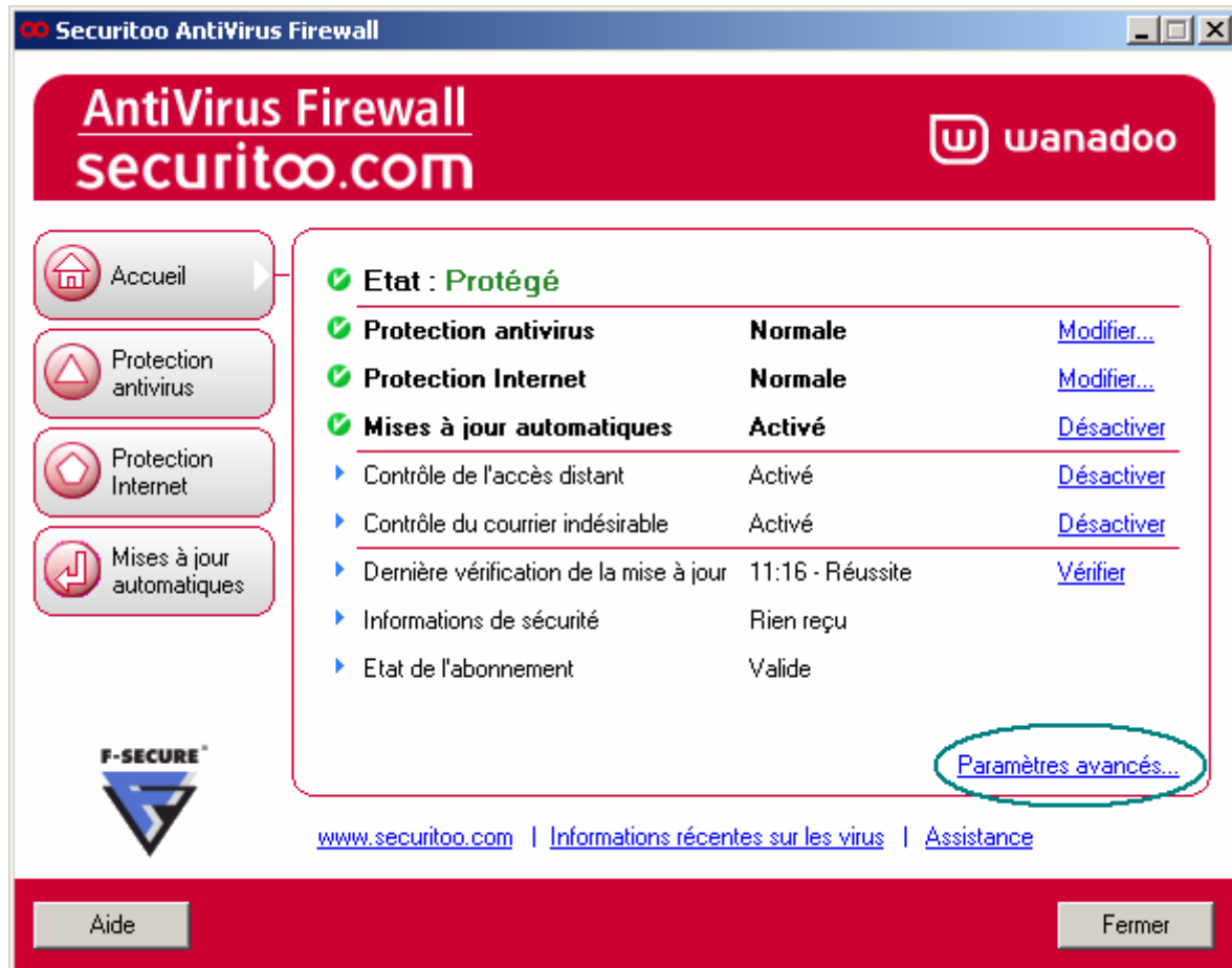
Figure 2 : Firewall

Etape 2 : Cliquez sur "Paramètres avancés..."