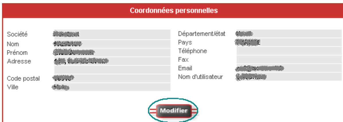
Figure 5 : Coordonnées personnelles

B : Vous pouvez également vérifier vos coordonnées personnelles en cliquant sur « Coordonnées personnelles ». Vous pouvez les modifier en cliquant sur le bouton Modifier .