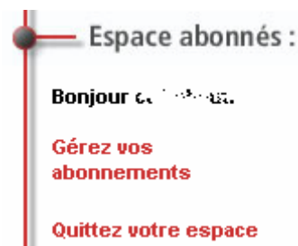
Figure 2 : Abonné identifié

Etape 2 : Une fenêtre « Espace abonnés » ressemblant à celle ci-dessous s'affiche :