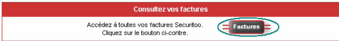
Figure 6 : Consulter vos factures

C : Vous pouvez aussi consulter vos factures en cliquant sur le bouton Factures .