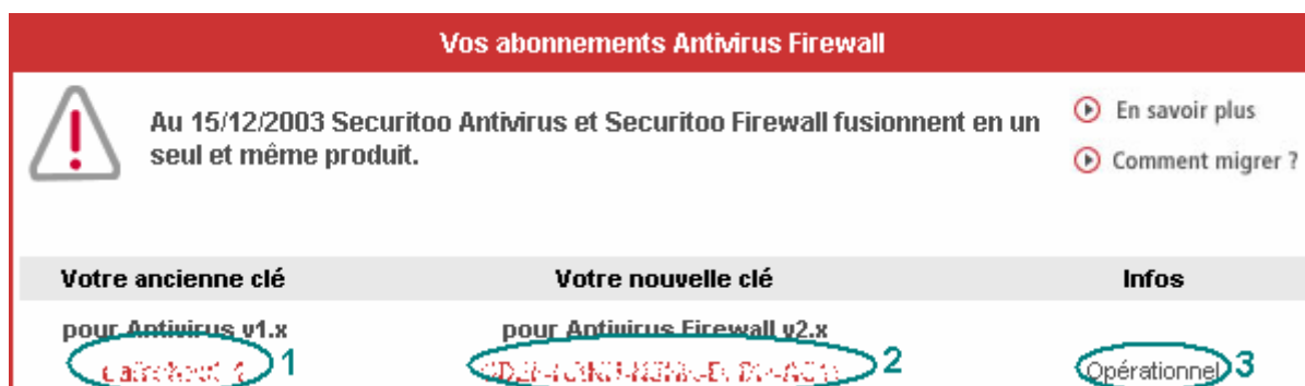
Figure 4 : Vos abonnements Securitoo

A : Vous pouvez consulter la liste de vos abonnements, voir combien de clés d'enregistrement sont à votre disposition, la correspondance ancienne clé (1) / nouvelle clé (2), ainsi que l'état (3) dans lequel se trouve votre abonnement.