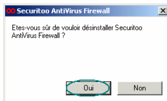
Figure 2 : Confirmation de la désinstallation

Etape 2 : Une fenêtre s'ouvre et vous demande de confirmer la désinstallation en cliquant sur le bouton Oui .