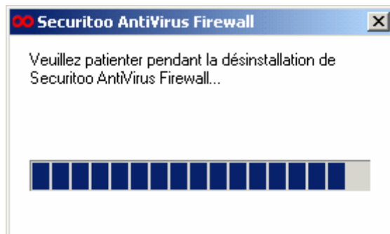
Figure 3 : Progression de la désinstallation

Etape 3 : Une fenêtre vous montre la progression de la désinstallation :