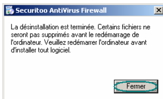
Figure 4 : Fin de la désinstallation

Etape 4 : Pour finaliser la désinstallation une fenêtre vous demande de redémarrer l'ordinateur. Cliquez sur le bouton Fermer .