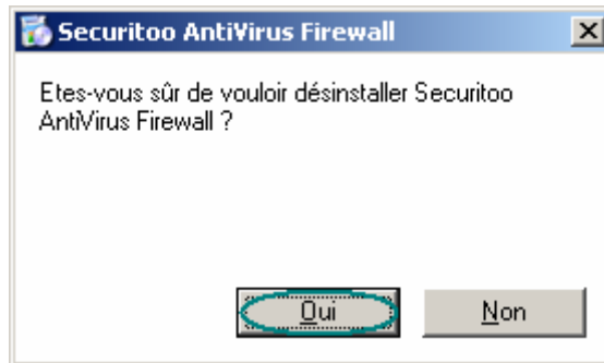
Figure 2 : Confirmation de la désinstallation

Etape 2 : Une fenêtre s'ouvre et vous demande de confirmer la désinstallation en cliquant sur le bouton Oui .