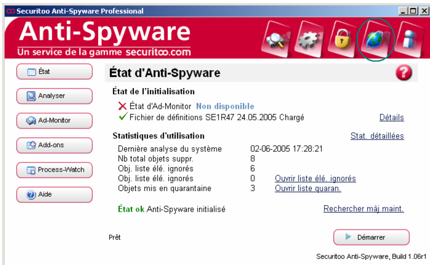
Figure 2 : Accueil

Etape 2 : Cliquez sur le globe terrestre, quatrième icône en haut à droite de la fenêtre.