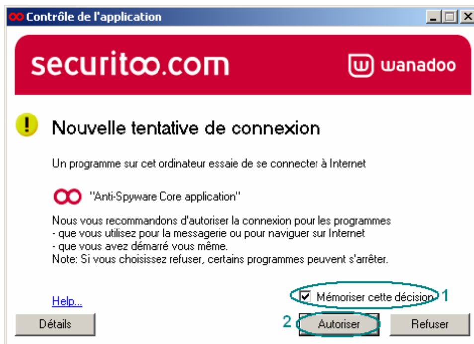
Figure 4 : Autoriser Securitoo Antispyware à se connecter

Etape 4 : Si votre Securitoo Antivirus Firewall est installé, il vous demande si Securitoo Antispyware peut se connecter à Internet sinon passez directement à l'étape 5 . Cochez la case "Mémoriser cette décision" (1), puis cliquez sur le bouton Autoriser (2).