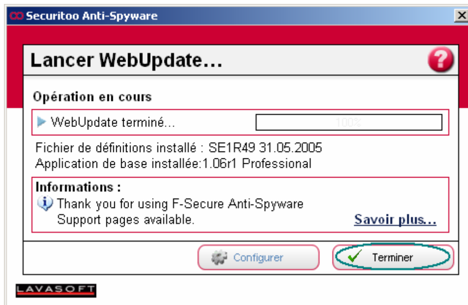
Figure 6 : Mises à jour terminées

Etape 6 : Une fois les mises à jour terminées, cliquez sur le bouton Terminer pour fermer la fenêtre.