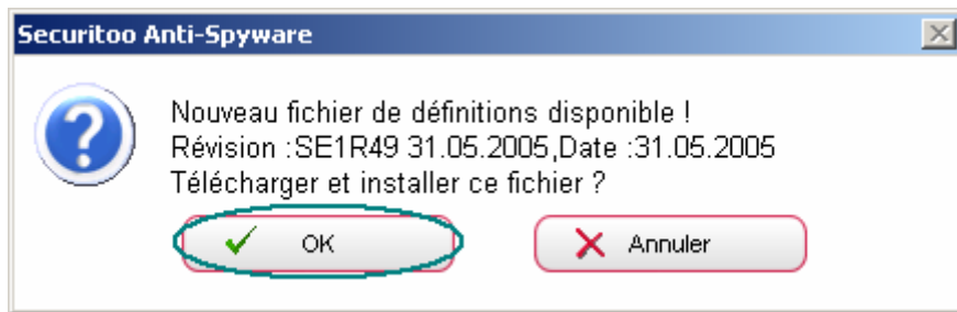
Figure 5 : Installation des fichiers de mises à jour

Etape 5 : Pour confirmer l'installation des mises à jour, cliquez sur le bouton OK .