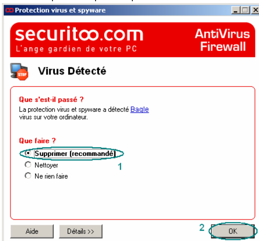
Figure 1 : Assistant de nettoyage - Suppression du virus

Etape 1 : Lorsqu'une fenêtre "Assistant de nettoyage" apparaît avec les virus trouvés. Au niveau de "Action", sélectionnez "Supprimer"(1). Puis, cliquez sur le bouton OK (2). La fenêtre suivante est un exemple de ce que vous pouvez obtenir.