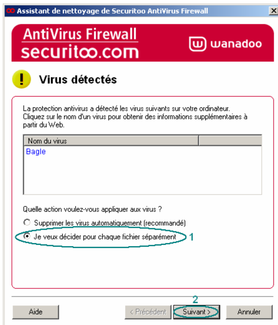
Figure 1 : Assistant de nettoyage – Virus détectés

Etape 1 : Lorsqu'une fenêtre "Assistant de nettoyage" apparaît avec les virus trouvés, sélectionnez "Je veux décider pour chaque fichier séparément" (1). Cliquez, ensuite sur le bouton Suivant (2). La fenêtre suivante est un exemple de ce que vous pouvez obtenir.