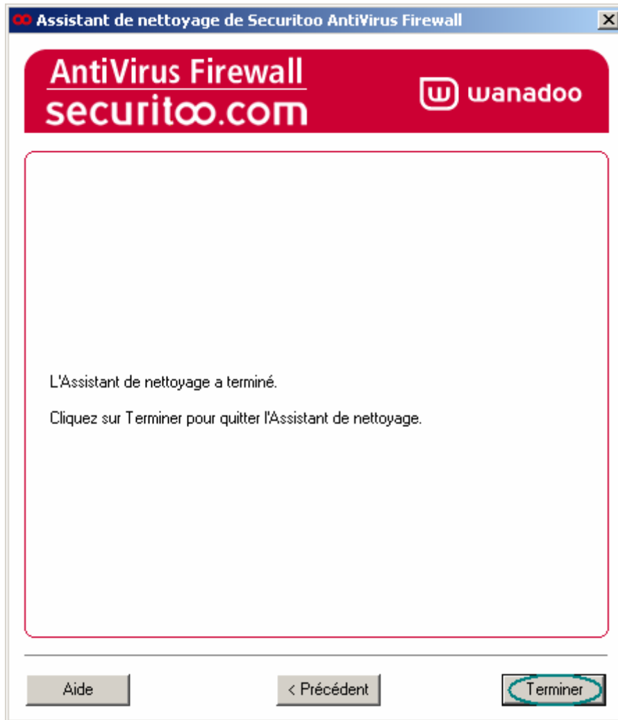
Figure 4 : Assistant de nettoyage terminé

Etape 4 : Cliquez sur le bouton Terminer pour fermer l'assistant de nettoyage.