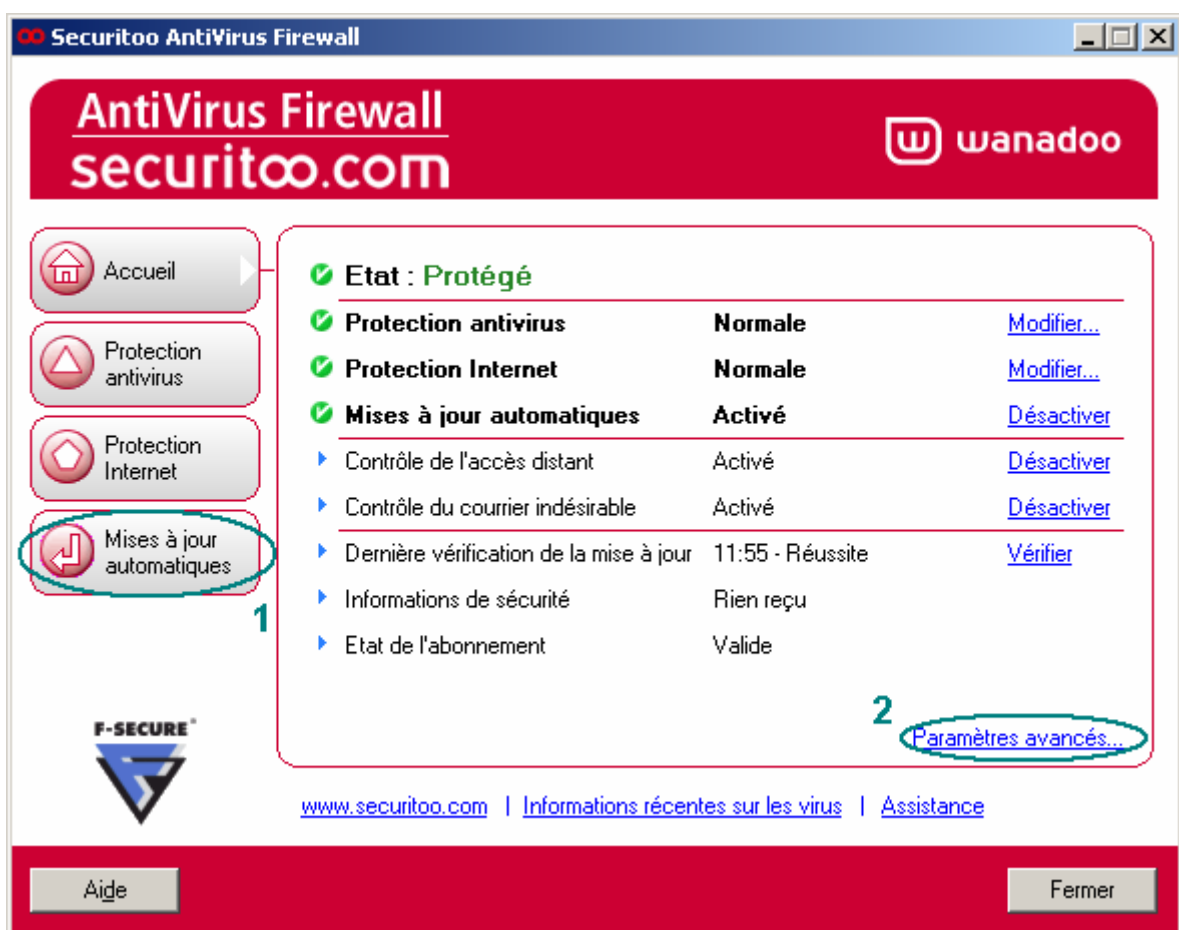
Figure 2 : Paramètres avancés des mises à jour automatiques

Etape 2 : La fenêtre suivante s'affiche. Cliquez sur le bouton Mises à jour automatiques (1) puis cliquez sur "Paramètres avancés..." (2).