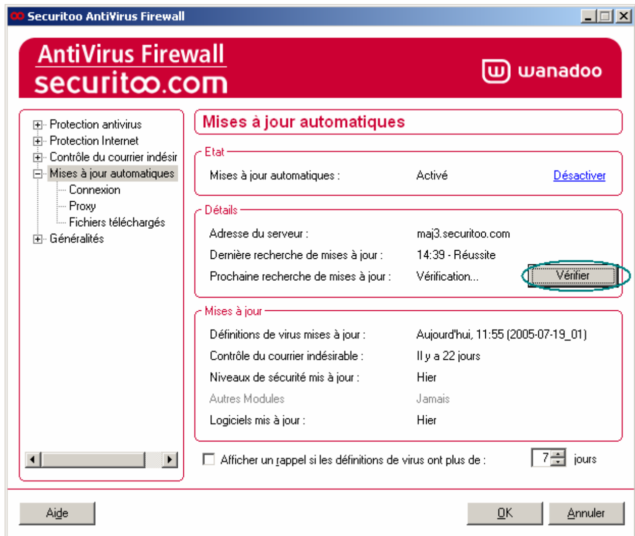
Figure 3 : Vérification des mises à jour

Etape 3 : La fenêtre suivante apparaît. Cliquez sur le bouton Vérifier pour faire les mises à jour.