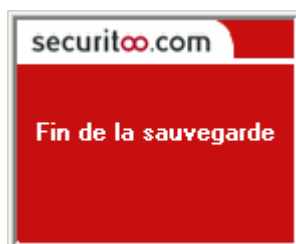
Figure 4 : Fin de la sauvegarde

Etape 4 : Lorsque la sauvegarde est terminée, la fenêtre suivante apparaît.