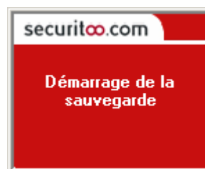
Figure 3 : Démarrage de la sauvegarde

Etape 3 : La fenêtre suivante annonce le début de la sauvegarde.