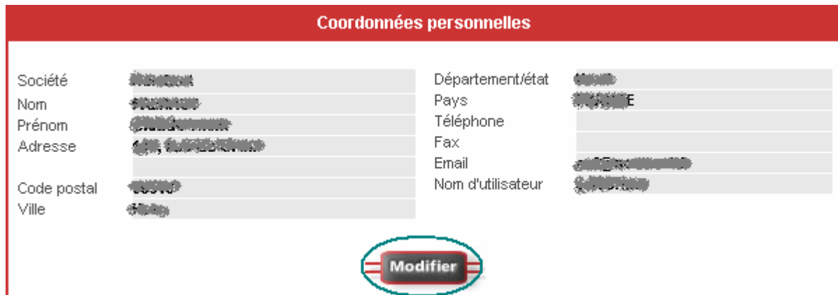
Figure 3 : Coordonnées personnelles

Etape 5 : Cliquez sur le bouton Modifier .