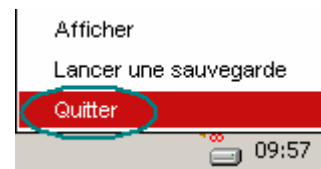
Figure 1 : Quitter