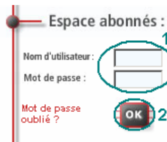
Figure 1 : Espace abonnés

La fenêtre ci-dessous apparaît. Au niveau de "Espace abonnés", dans les champs "Nom d'utilisateur" et "Mot de passe" (1), entrez vos informations personnelles (Nom d'utilisateur et Mot de passe) fournies sur le courrier d'abonnement. Cliquez ensuite sur le bouton OK (2).