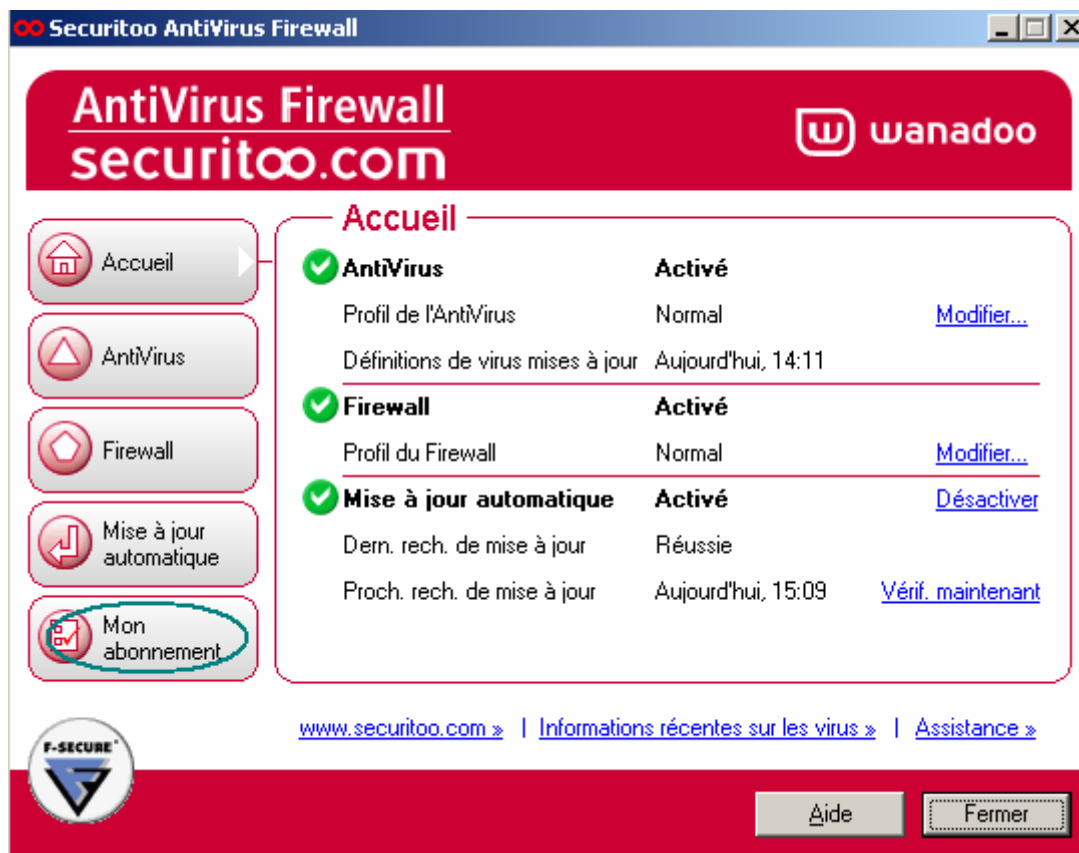
Figure 2 : Accueil de Securitoo

Etape 2 : Une nouvelle fenêtre s'ouvre. Cliquez sur le bouton Mon Abonnement .