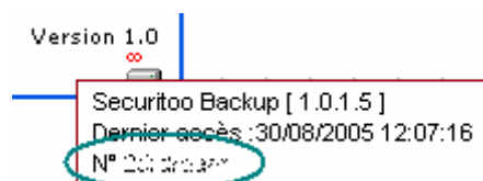
Figure 2 : Clé d'enregistrement

Etape 3 : A bas à gauche de la fenêtre, laissez la souris quelques seconde sur "Version". Votre clé d'enregistrement apparaît alors.