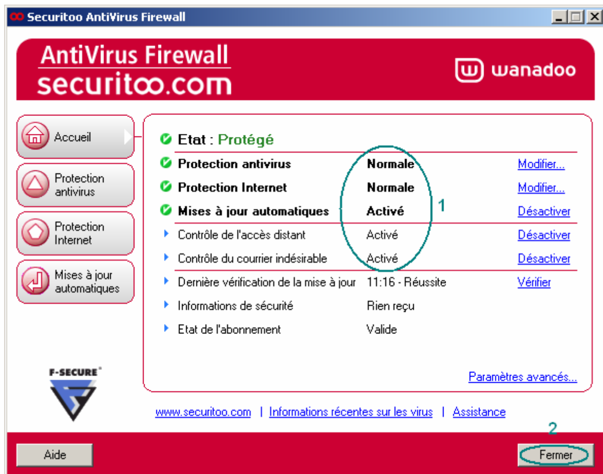
Figure 2 : Protection activé

Etape 2 : L'accueil de Securitoo s'ouvre. Si les cinq applications (Protection antivirus, Protection Internet, Mises à jour automatiques, Contrôle de l'accès distant et Contrôle du courrier indésirable) sont à l'état "Activé" (1), Securitoo est bien actif sur votre PC. Vous pouvez alors fermer cette fenêtre en cliquant sur le bouton Fermer (2).